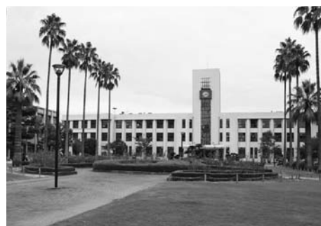
ワシントン椰子のある風景

現在、1号館前庭は9月下旬完成をめどに改修工事が行われていて、一旦は芝生広場としたあと学内の検討委員会で今後の整備計画を検討するとのことです。どんな景観が創られるのか楽しみにしたい。